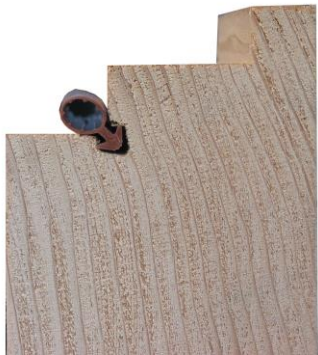
45° Fräsung ohne Hohlkehle bei normler Fensterluft

Zur nachhaltigen Abdichtung von Fenstern und Türen ist es wichtig, die der Situation optimal angepasste Frästechnik sowie eine technisch ausgereifte langlebige Dichtung zu verwenden.