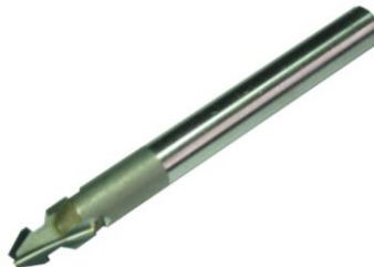
HM-Ankerfräser Ankerprofil und Hohlkehle in einem Arbeitsgang