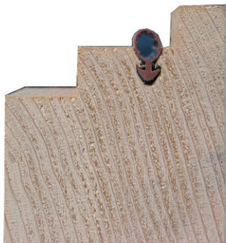
90° Fräsung mit Hohlkehle z.b. für Türabdichtungen