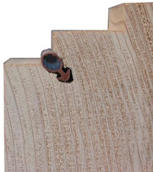
45° Fräsung mit Hohlkehle bei kleiner Fensterluft