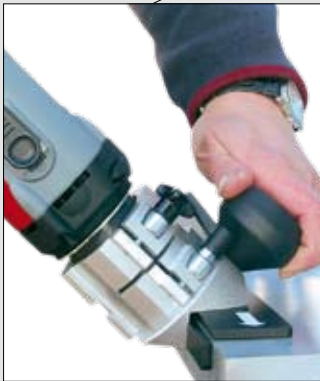
Als Handmaschine für grosse Werkstücke mit linearen Kanten...