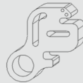
Schnellwechseleinsatz Tisch mit Anschlagfinger (gehärtet)