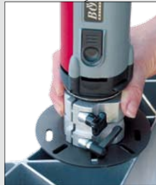
Als Handmaschine für grosse Werkstücke mit Konturen...