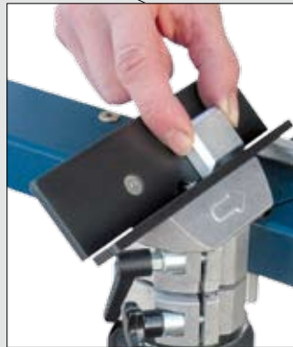
... oder mit der Tischhalterung für kleine Werkstücke mit linearen Kanten